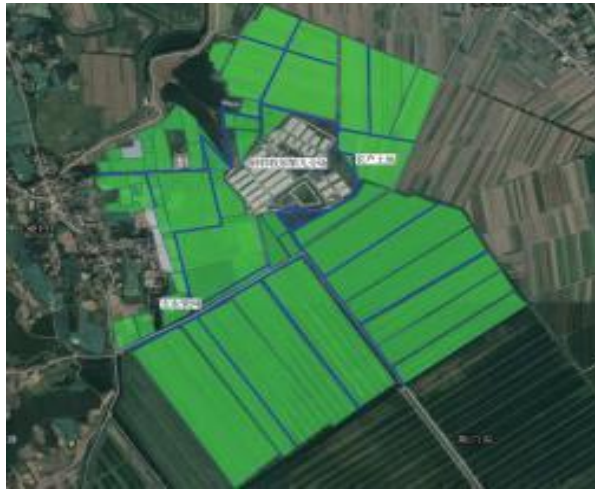
图3 钟祥牧原九场及施肥管网图示

钟祥牧原九场及施肥管网见图3。施肥管网铺设在场区周边的农田地头，铺设深度约1m，沼液由沼液储存池配套的还田泵输送。管道是PVC材质，直径分主管200mm，支管160mm，出水管110mm或75mm两种。其中，可移动临时水管的特征如下：蓝水带，外径80mm，长度一般为20m，材质为化纤涤纶经过圆筒编织而成，厚度为15mm以上，可承受0.6~0.8MPa压力。透明喷带，长度为100m每盘，孔径为15mm，塑料材质，直径90mm，孔距30cm（图2）。粪肥还田地块区域信息见表13。