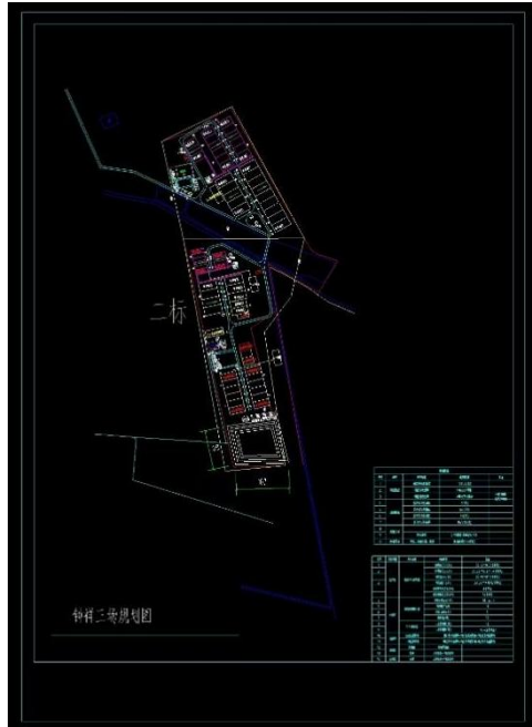
图 1 场区总平面布置图