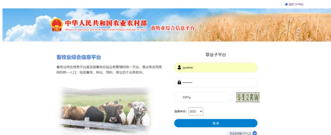
图 1 “畜牧业综合信息平台—草业子平台”主页

一、登陆“畜牧业综合信息平台—草业子平台”主页，网址“ http://foragegrass.nahs.org.cn/ht/login/login.html ”，主页界面如图 1。