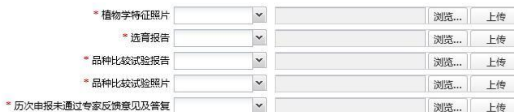
图 5 附件上传功能区示意图

七、确认已按照填报说明完成填报并保存后，点击“提交”按钮提交申报材料，等候形式审查。形式审查一般不超过 3 个工作日。必填项未填写（或未上传必需附件）的申请无法提交形式审查。