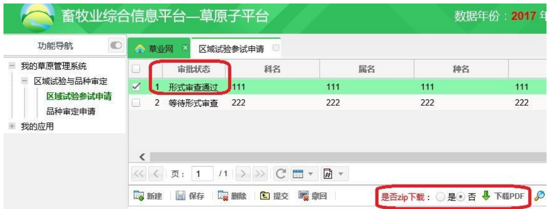
图 6 审批状态显示示意图

九、超过申请截至时限后，审批状态为“录入”的申请将无法提交；形式审查未通过被退回的申请，可点击 查看形式审查未通过意见 按钮，按照系统提示的退回理由进行修改完善后再次提交。