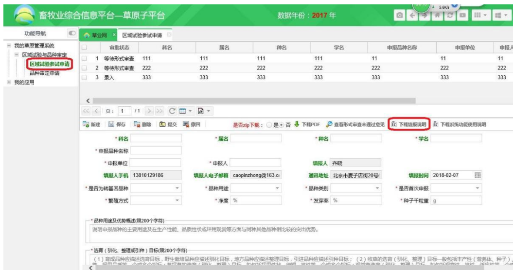
图 3 申报界面

四、登录系统后点击页面左侧导航栏“区域试验参试申请”，进入区域试验参试申请页面（图 3）。点击“下载填报说明”按钮下载填写各栏目和编写各附件（报告、证明等）的具体要求。