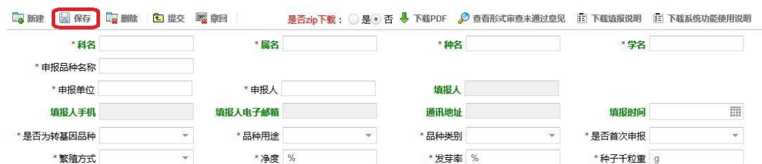
图 4 首次保存时必须填写的栏目

五、仔细阅读填报说明后，点击“新建”按钮开始逐项填写。须至少填写完图 4 所示栏目后才可以点击“保存”按钮生成一条新记录，然后可随时点击“保存”按钮进行保存。